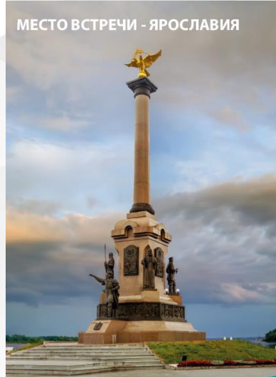
МЕСТО ВСТРЕЧИ - ЯРОСЛАВИЯ