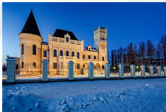
ТРК «Золотое кольцо»